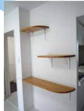
キャットウォーク